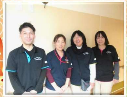
ショートステイ(3階)