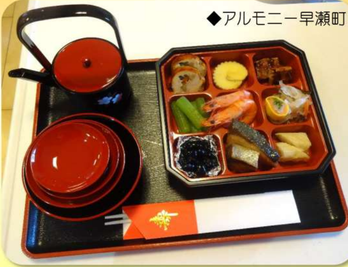
◆アルモニー早瀬町

お正月といえば「おせち」ですよ！今年も利用者様に正月気分を味わって頂くために、“正月の味”をご用意致しました。意外と豪華だと思うのですが...どうでしょうか！？