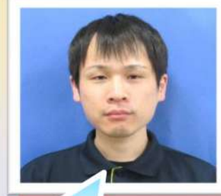
特養ケアマネージャー