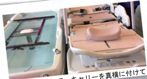
◎浴槽にシャワーキャリーを真横に付けて...