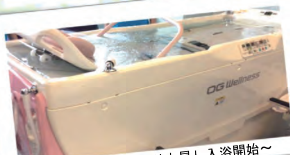
④浴槽がゆっくり上昇し入浴開始～