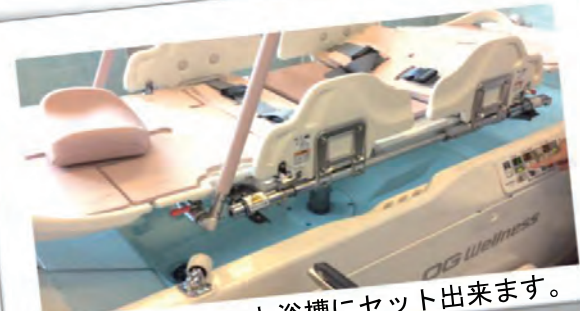
⊕ガチャンと浴槽にセット出来ます。