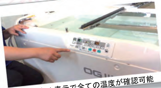
デジタル表示で全ての温度が確認可能

今回は「特別養護老人ホーム なごみの里」で使用している一部の入浴機材についてご紹介したいと思います！介護の入浴には、一般浴や機械浴、リフト浴など色々ありますが、その中でも寝たきりの方や座位が保てない方も安心・安全に入浴できる「特殊浴」を見ていただこうと思います。