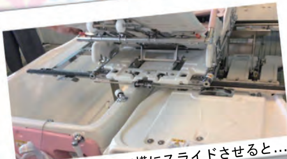
◎ロックして横にスライドさせると...