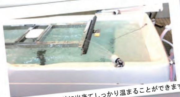
泡風呂+掛け湯が同時に出来てしっかり温まることができます！