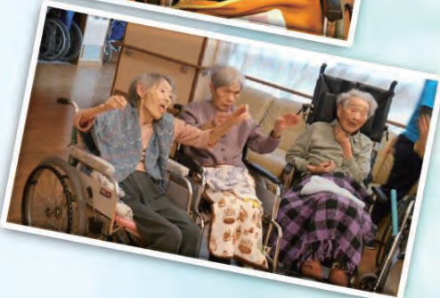
準備運動もしっかりと！

本来であれば特養全体で執り行いたいところではありますが、感染リスクに配慮し、少し規模を縮小してミニ運動会を行いました。いつもと変わりなくお元気そうに競技を楽しめました♪来年はもっと盛大に出来るといいですね(*^▽^*)