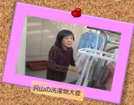
沢山の洗濯物大変