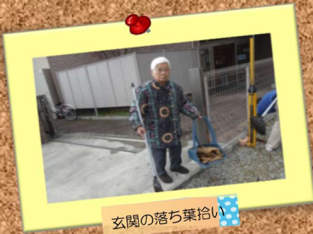
玄関の落ち葉拾い